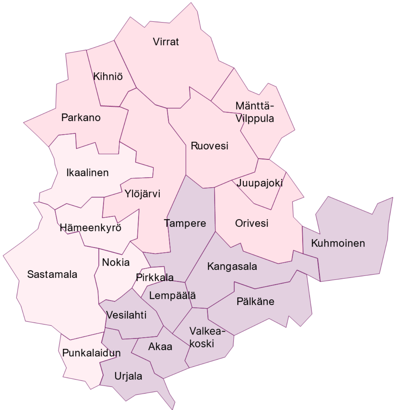
Kuva 1 Pirkanmaan hyvinvointialueen aluejako, jota käytettiin hyödyksi panelistien valinnassa 1